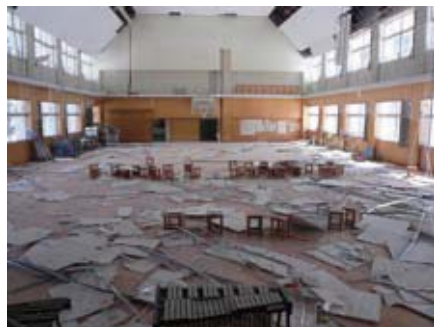
散乱した天井パネル