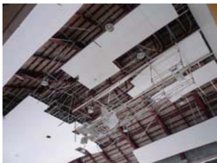
天井パネルの損壊

改築中の学校を除いて、区内の全小中学校の耐震化は完了しています。しかし、教室や体育館などの天井材や設備・備品類には耐震基準がないため、震災時には天井材などがはがれ落ちる危険性があります。児童・生徒の安全と、避難所としての機能を強化するために耐震点検を実施します。