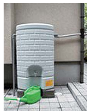
▲雨水タンク設置イメージ

屋根などに降った雨水を貯めるタンクで、貯めた水は植木の水やりや、非常時の生活用水として利用できます。雨水を利用することで節水につながり環境保護と、水道代の節約にもなります。